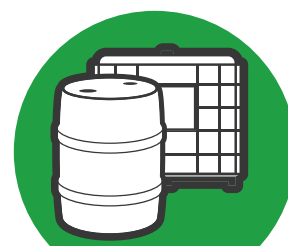
Réservoirs et barils

Procurez-vous gratuitement des sacs de collecte auprès de votre détaillant. ** Placer les contenants vides et rincés dans le sac de collecte en ayant pris soin de retirer les livrets et les capuchons.