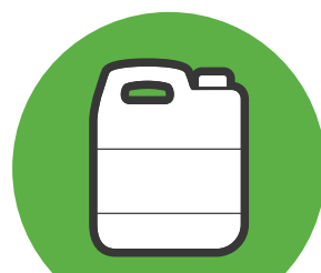
Bidons jusqu'à 23 l

Rapporter les matières préparées convenablement à votre détaillant agricole participant. Vérifier au préalable quelles matières sont acceptées.