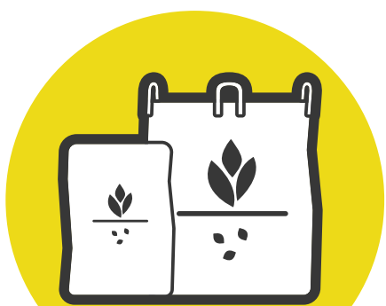
Sacs de semences, de pesticides et de fertilisants